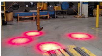
FAISCEAU À SPOT